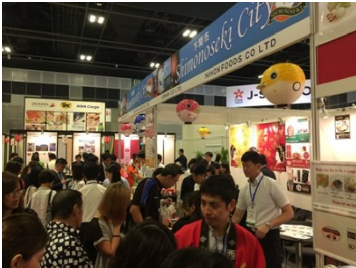
Food Japan2016下関ブースのようす (2016/10/27～29 於：サンテックシンガポール)

製品の販路拡大や、工場・店舗の進出で海外展開をお考えの方、ぜひ下関地域商社までお気軽にお問合せください。